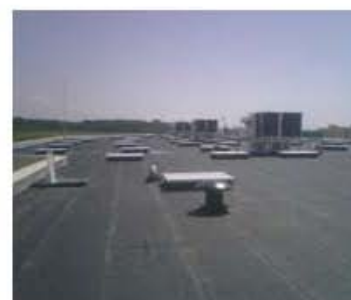
CLARATEC EVACUM CUADRADA (mm.)